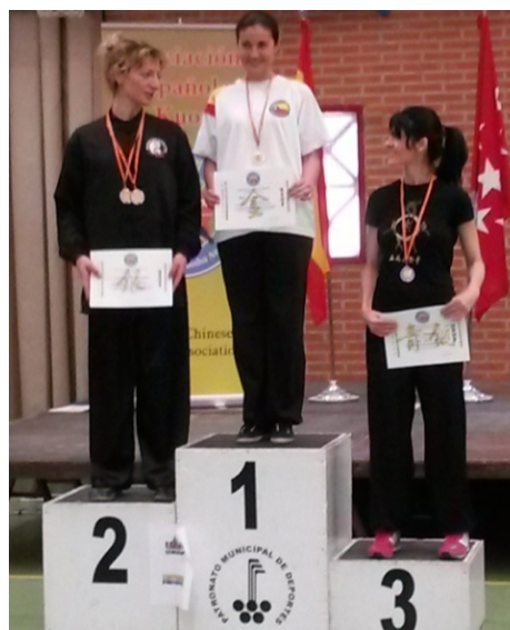
Tai Chi individual mano vacía. Plata

Desde el Club también se colaboró en las tareas de Organización de este V Campeonato de España de Kuoshu, aportando tres miembros al equipo arbitral y un auxiliar de apoyo.