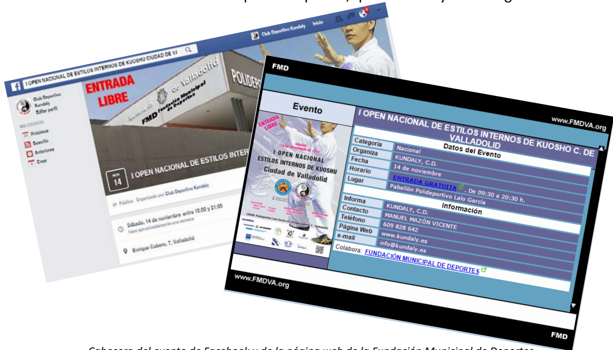
Cabecera del evento de Facebook y de la página web de la Fundación Municipal de Deportes

También se incluyeron publicaciones sobre el Open en la página de Facebook del Club, creándose un evento específico. A nivel institucional, la información básica del Open fue remitida a la Fundación Municipal de Deportes, quien la incluyó en su agenda.