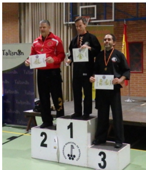
Taolu mano vacía. Oro y Bronce