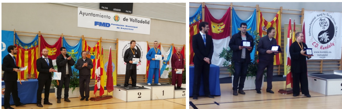
Entrega de premios correspondiente a la sesión de la mañana realizada por el Consejero de Participación Ciudadana, Juventud y Deportes del Ayuntamiento de Valladolid y por el Gerente de su Fundación Municipal de Deportes.

Entrega de placas por parte de la Asociación Española de Kuoshu al Ayuntamiento de Valladolid, a su Fundación Municipal de Deportes y al CD Kundaly como reconocimiento a su labor de organización.