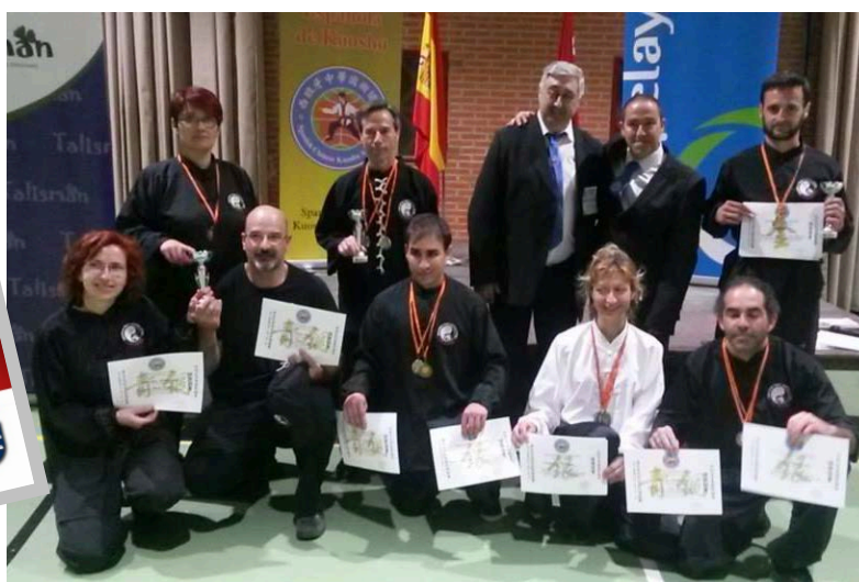
Parte del equipo del Club luciendo los trofeos y diplomas obtenidos en el V Campeonato de España de Kuoshu.