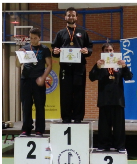
Tui Shou móvil. Oro y Bronce