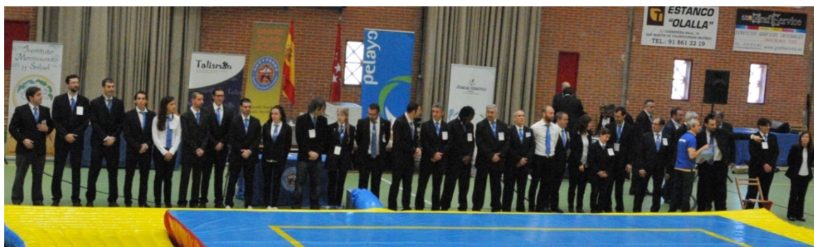
Equipo arbitral del V Campeonato de España de Kuoshu al completo.

Desde el Club también se colaboró en las tareas de Organización de este V Campeonato de España de Kuoshu, aportando tres miembros al equipo arbitral y un auxiliar de apoyo.