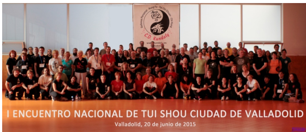
Foto de grupo. Maestros y participantes.

El I Encuentro Nacional de Tui Shou Ciudad de Valladolid se celebró el 20 de junio en el Polideportivo Pilar Fernández Valderrama. En este Encuentro, Maestros de reconocido prestigio en la práctica de diferentes estilos de Tai Chi Chuan, buena parte de ellos llegados a la capital vallisoletana desde otras Comunidades Autónomas (como Galicia, Comunidad Valenciana o Madrid), impartieron sus talleres. Así, se puso a prueba, por primera vez, la capacidad de convocatoria del Club, que logró superar el centenar de inscritos llegados desde todo el territorio nacional, una participación inusitadamente elevada para una actividad exclusivamente dedicada al Tui Shou o empuje de manos.