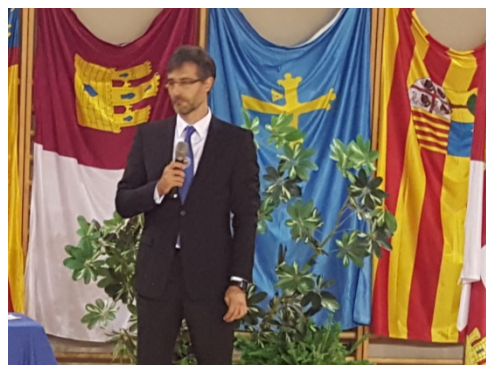
Competición de Tui Shou y discurso de Clausura del Open por el Presidente de la Asociación Española de Kuoshu.

La participación lograda en este Open, considerando que nos encontramos ante su primera convocatoria y se limita exclusivamente a las disciplinas internas incluidas en Kuoshu (Tai Chi, Chi Kung y Tui Shou), puede considerarse prometedora de cara a próximas convocatorias. En concreto, se situó en más de cien participaciones de competidores procedentes de un total de ocho Comunidades Autónomas diferentes.