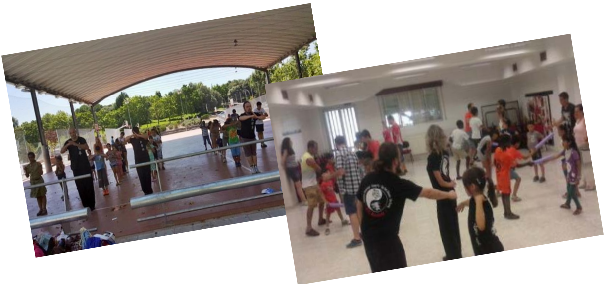
Momentos de los talleres impartidos por los voluntarios del Club para Red Íncola

En este sentido, durante el pasado verano, un grupo de voluntarios del Club han impartido talleres de defensa personal y Kung Fu gratuitos para niños y niñas de 6 a 12 años dentro de los campamentos urbanos de verano «Sueño de Colores» que viene desarrollando dicha Fundación.