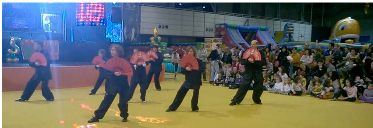
Momentos de las exhibiciones del Club en Navival 2015