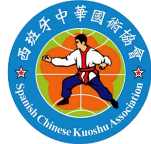
International Chinese Kuoshu Federation