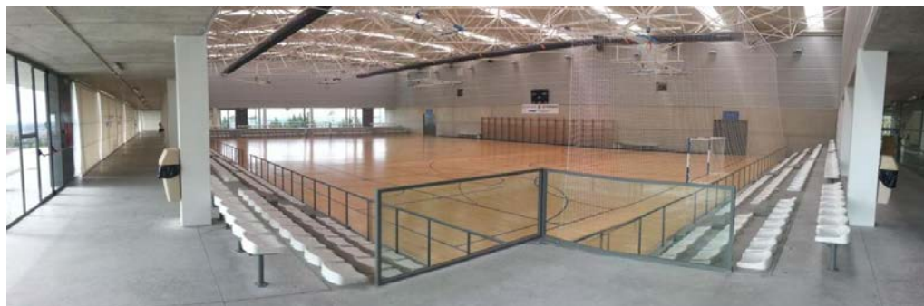
Instalaciones del Polideportivo Lalo García.

En su primera edición se desarrolló, como estaba previsto, en el Polideportivo Lalo García (Calle Enrique Cubero, 7), durante todo el sábado 14 de noviembre.