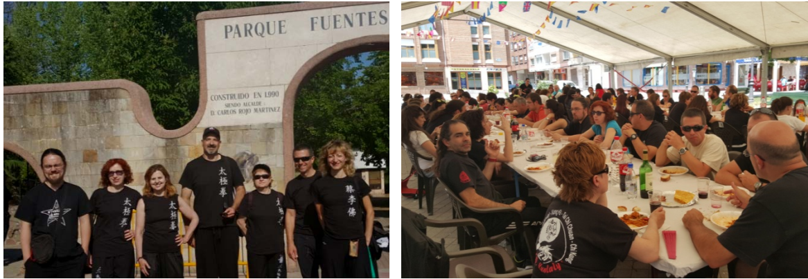
Llegada de los representantes del Club al Parque Fuentes Carrionas y comida posterior al Encuentro.

Además de ofrecernos talleres gratuitos nos dieron la oportunidad de participar en la exhibición que tuvo lugar al final de la mañana.