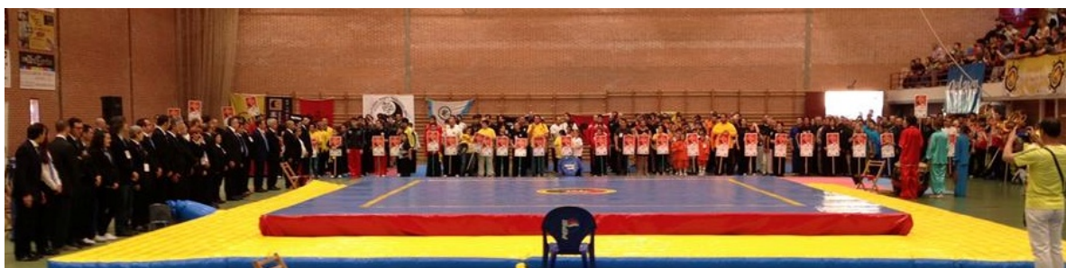
Formación de atletas y del equipo arbitral para dar inicio al Campeonato.

En esta edición la afluencia de atletas fue masiva, superando los 300, procedentes de más de una treintena de Escuelas y Clubes de todo el territorio nacional.