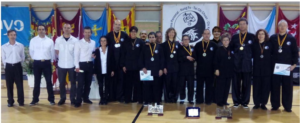
Equipo de colaboradores y atletas del Club con las medallas y trofeos conseguidos en el I Open de Estilos Internos de Kuoshu Ciudad de Valladolid

En el aspecto puramente deportivo del Open, el CD Kundaly obtuvo unos resultados que pueden calificarse como excelentes. Sus 13 atletas lograron un total de 14 trofeos (de ellos 6 medallas de oro y 4 de plata) a los que se sumaron el premio a la mejor atleta femenina del Open y al Mejor Club. Junto a la demostrada calidad de sus atletas, también es preciso destacar el esfuerzo realizado por todos ellos al participar en todas las categorías presentes en el Open.