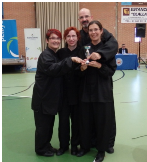
Tai Chi grupos mano vacía. Bronce