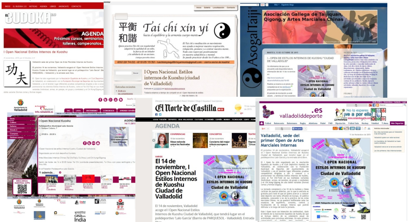
Difusión del Open en diferentes medios.

También apareció anunciado en diferentes páginas web especializadas en artes marciales, en Tai Chi y Chi Kung en particular, e incluso de ámbito deportivo más general.